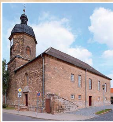
(19) St.-Laurentius-Kirche Karsdorf