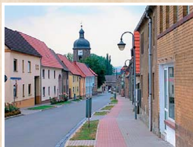
(21) Ortsansicht Karsdorf