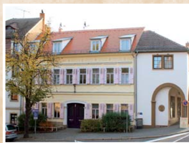
(22) Zeitz, Altmarkt 3, 2011